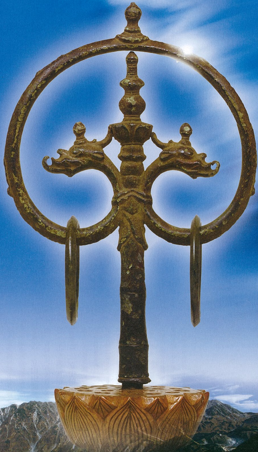
①銅錫杖頭(大日岳出土)重要文化財