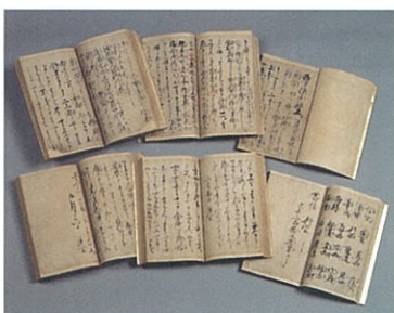
国宝／西方指南抄(さいほうしなんしょう)／鎌倉時代 ◆親鸞真筆による法然の伝記

歴史のうねりを越えて伝わった、鎌倉時代以来の歴史や美を伝えるこれらの品々を通して、親鸞とその弟子たち、そして真宗高田派の歴史に、思いを馳せてみてはいかがでしょうか。