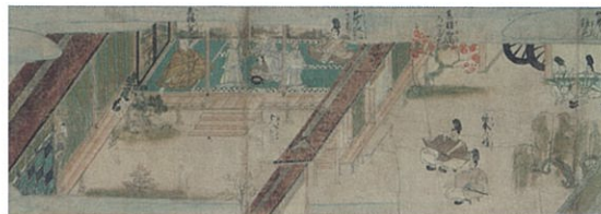
重要文化財／親鸞聖人伝絵(しんらんしやうにんでんえ)／南北朝時代◆伝絵でたどる親鸞の一生

13棟の重要文化財に指定されている、専修寺の建築と、MieMuの展示をともにお楽しみください。