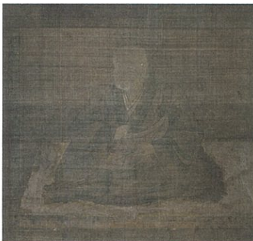
県指定文化財／真慧上人像(しんねしやうにんぞう)／室町時代◆関東から伊勢国一身田にお越しになった高田派第10世