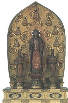
一光三尊仏(いっこうさんぞんぶつ)／旧光寿寺所蔵 ◆一光三尊仏をはじめ各高田派寺院が所蔵する貴重な品々もあわせて展示