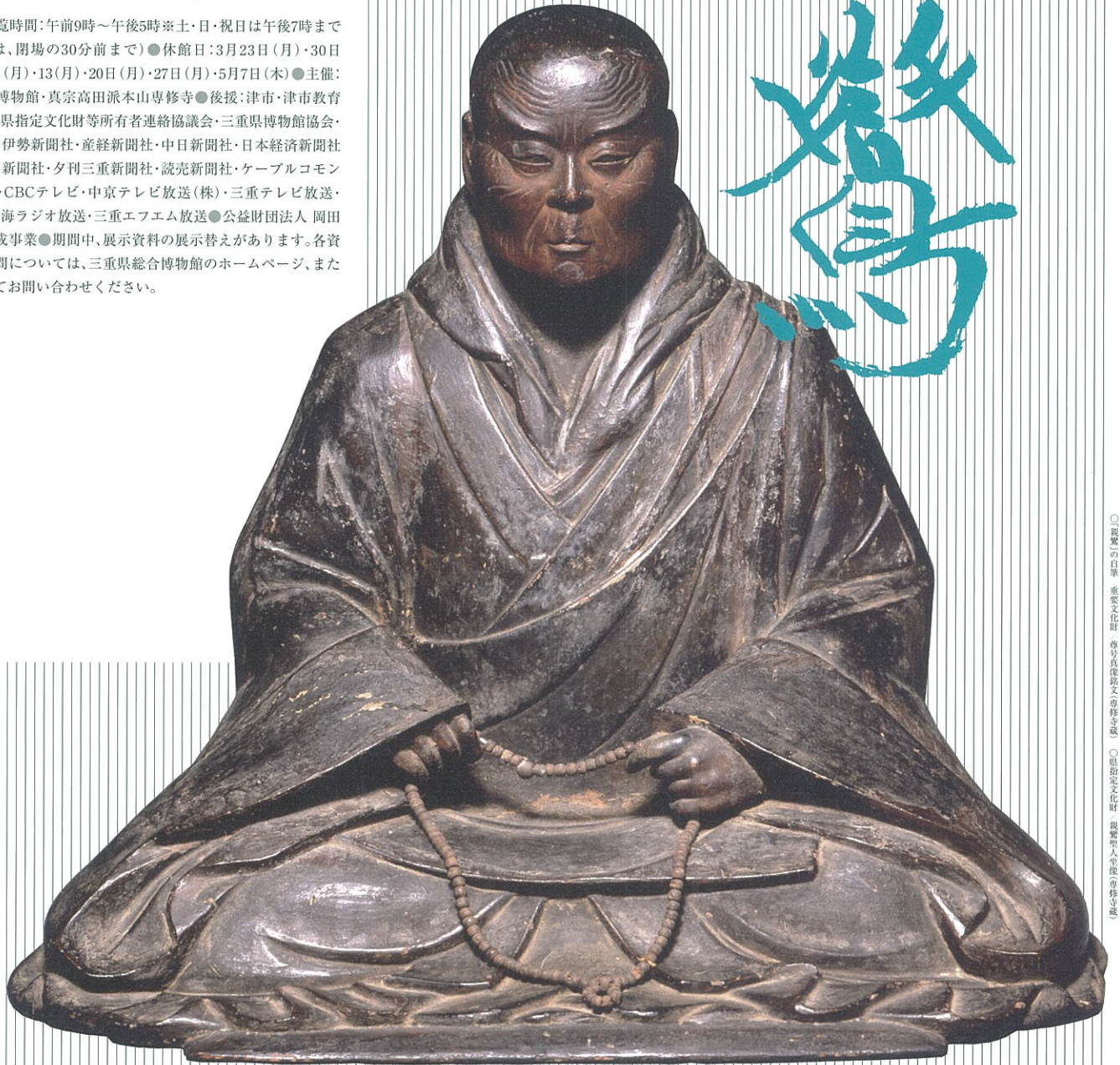
○親鸞の自筆 重要文化財 写真真像（岡田文化財団蔵） ○指定文化財 重要文化財 写真真像（専修寺蔵）