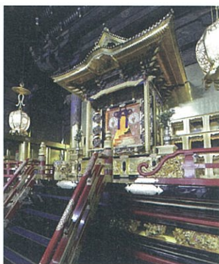
専修寺の巨大な御影堂内の様子