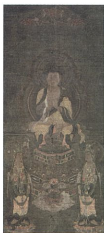
重要文化財／阿弥陀三尊像(あみださんぞんぞう)／鎌倉時代