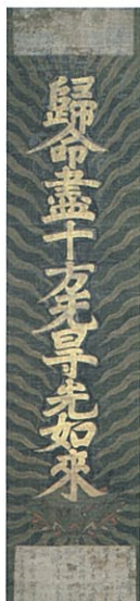
紺地十字名号副本(こんじじゅうじみょうごうふくほん)／南北朝時代◆専修寺の堂舎が古くから大きかったことを示すという