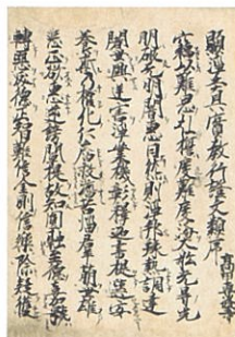
重要文化財／顕浄土真実教行証文類(けんじょうどしんじつきょうじょうしゅうもんるい)◆親鸞の主要著作