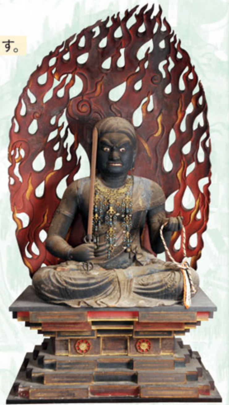
▲珠洲市指定文化財 不動明王坐像 法住寺蔵 [全期間]