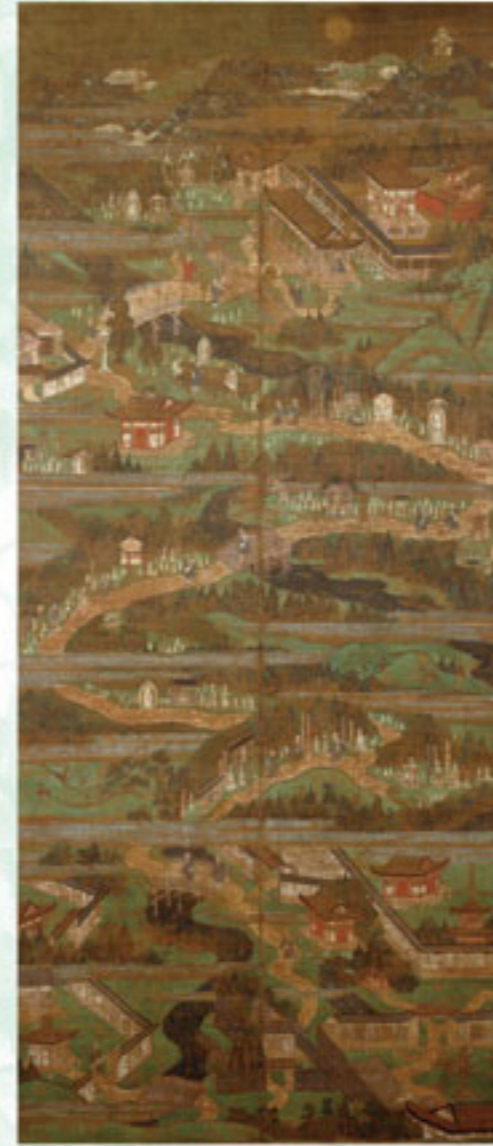
◀高野山参詣曼荼羅 東京藝術大学美術館蔵 [前期]