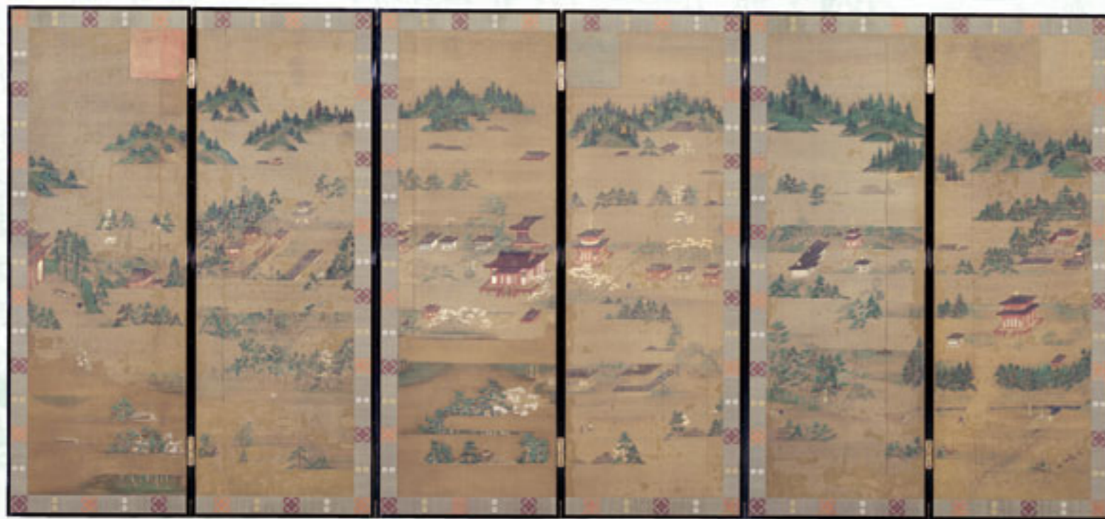
◀重要文化財 高野山水屏風 京都国立博物館蔵 [後期]