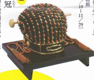
国宝 玉冠 〔琉球国王尚家関係資料のうち〕 第二尚氏時代・18〜19世紀 沖縄・那覇市 〔展示期間11/10〜11/3〕

重要文化財 遮光器土偶 (青森亀ヶ岡出土) 縄文時代・紀元前1000年〜紀元前400年 東京国立博物館