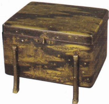
国宝 沢千鳥螺鈿蒔絵小唐櫃 平安時代・12世紀 和歌山・金剛峯寺

このたびの展覧会は、縄文時代から鎌倉時代に至るまでの日本美術の至宝を一堂に集め、「美の国日本」が形成されてゆく軌跡をたどろうとする試みです。さらに、京都やその周辺で形成された美意識だけを眺めるのではなく、北方の蝦夷地や南方の琉球で育まれた美の諸相も取り上げること、より複眼的な視点から「美の国日本」を見つめてみたいと思います。