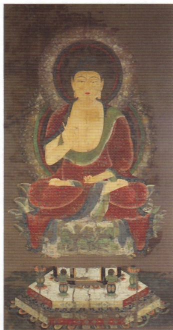
国宝 釈迦如来像 平安時代・12世紀 京都・神護寺 〔展示期間11/10〜11/29〕