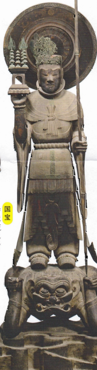
国宝 多聞天立像 (四天王のうち/金堂所産) 飛鳥時代・7世紀 奈良・法隆寺