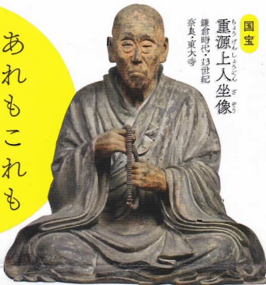
国宝 重源上人坐像 鎌倉時代・13世紀 奈良・東大寺