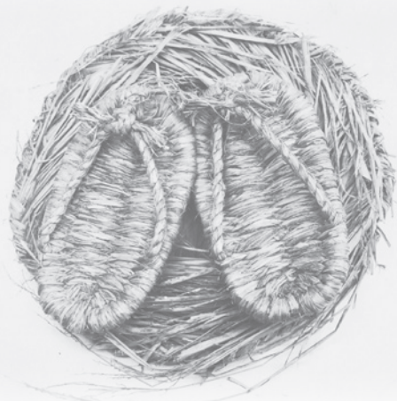
神奈川大学日本常民文化研究所蔵 アチック写真 [目録番号] 河 1-16-10

人類は、道具を手にし、かつ言葉を獲得しそれを駆使することで「文化」的に展開したが、その行動適応の中で作られ用いられてきた道具類は、極めて早い時期に基本的な構造は完成しており、その姿や働きが、今日まで引き継がれているものも多く認められる。実際、民具は多様であるが、基本的な民具には、時代や地域、国や民族を越えて、共通する性格を見出すこともできるのではないかと。生活文化の比較は言語による認識の形成の違いが反映し、複雑に交錯するので多くの困難が伴うが、“暮らし”の中で作られ、使われてきたモノ、民具の基本的な形態や機能を手がかりにする方法論を確立することで、生活文化の基本的なありかたの国際的な比較ができる。このフォーラムで、民具を通して“人”の個性と普遍性を探る国際常民文化研究の可能性の一例を提示したい。