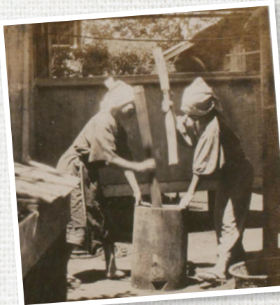
神奈川大学日本常民文化研究所蔵 アチック写真 上 [目録番号]ア-9-89 左下[目録番号]ア-105-2-2