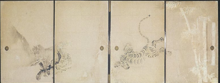
竹に虎図襖(部分) 江戸時代 前期

前期:2月20日(土)~3月21日(月・振休) / 後期:3月23日(水)~4月17日(日)