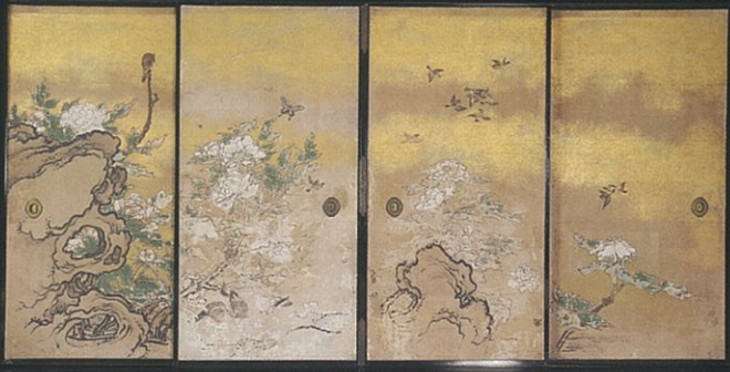
花鳥図襖(部分) 江戸時代 前期