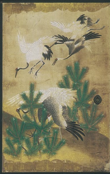
「群鶴図」実相院蔵 群鶴図襖(部分) 江戸時代 前期

京都洛北、岩倉の地に所在する実相院。そこは皇族や上級貴族出身の僧侶が住職となる門跡寺院でした。諸方面から尊崇された実相院には、格式の高さが窺える数多くの資料や建造物が残されています。 平成二十七年三月に京都市文化財に指定された「実相院文書」は、中世に遡る門跡寺院の歴史を鮮やかに描き出し、文化の重要拠点であったことを物語る文書とあわせて、歴史資料として極めて高い価値を有しています。 また、江戸時代に活躍した狩野派の雄大な襖絵や杉戸絵、表情豊かに気品溢れる仏像は、四季折々に美しい姿を見せる庭園とともに、その荘厳な空間を構成しています。 本展覧会では、これらの資料を通して、秘められた門跡寺院の歴史に迫ります。