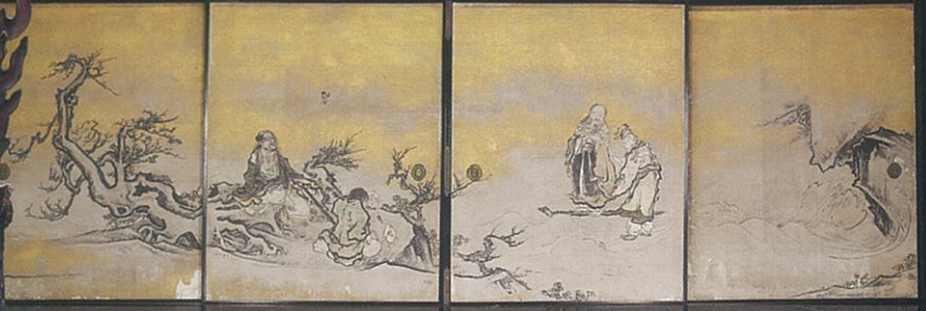
群仙図襖(部分) 江戸時代 後期