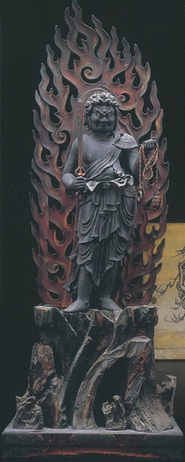
本尊 木造不動明王立像 鎌倉時代 通期