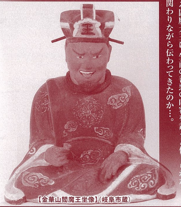
【金華山閻魔王坐像】(岐阜市蔵)