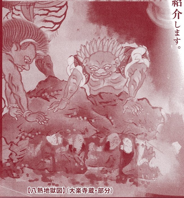
【八熱地獄図】(大衆寺蔵・部分)

立山と地獄、まさに一対の存在として同一視されてきた 山岳信仰の歴史的過程を紹介します。