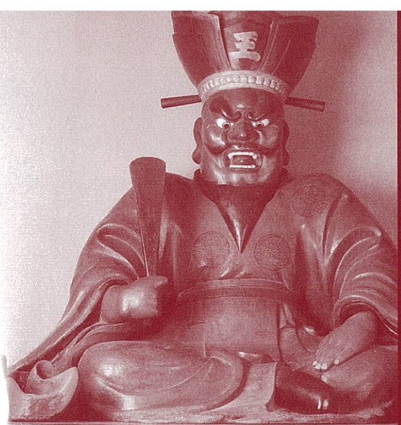
【木造閻魔大王坐像】(芦峯寺閻魔堂蔵・県指定文化財)

亡者の地獄行きを判定する閻魔大王は、生前の善悪の内容を裁くと信じられた。 立山と閻魔、どのように関わりながら伝わってきたのか…。