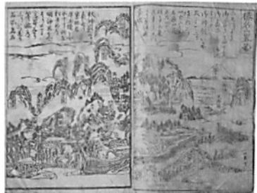
江戸の旅行ガイド「上州榛名詣」(宮之坊所蔵)