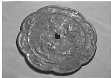
榛名湖から出土したと伝えられる鏡(榛名神社所蔵)