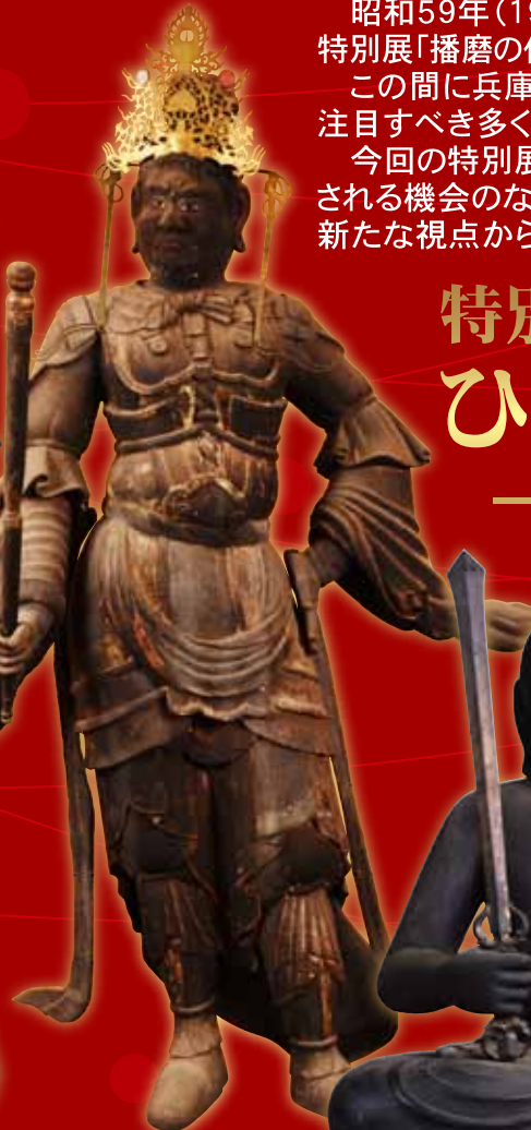
▲重文 毘沙門天立像／随願寺蔵