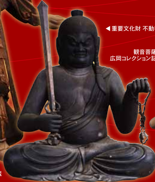
◀重要文化財 不動明王坐像／瑠璃寺蔵