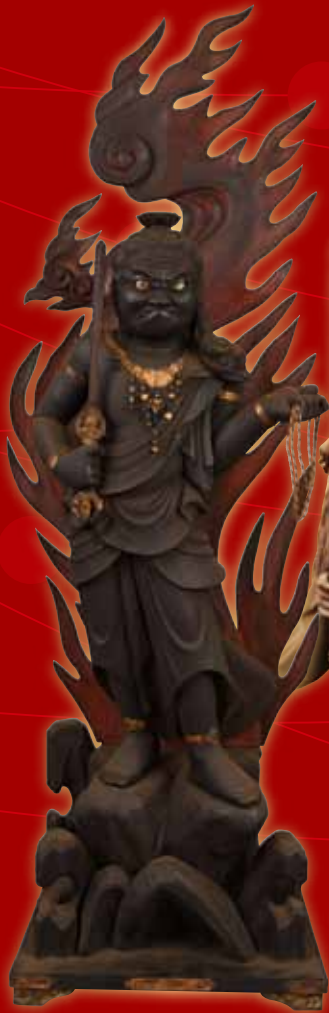
▲不動明王立像／性海寺福智院蔵