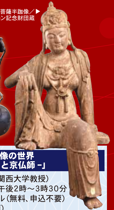
観音菩薩半跏像／ 広岡コレクション記念財団蔵 ▶