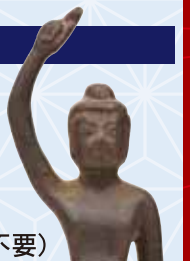
誕生釈迦立像／應聖寺蔵▲