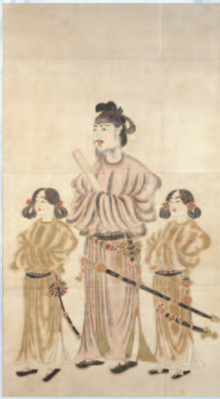
聖徳太子・二王子像(江戸時代、法隆寺所蔵)

本展では、元興寺創建の前史として、法興寺の実像に出土遺物などから迫るとともに、関連寺院をはじめ各地に残された法興寺に関わる有形無形の文化遺産を紹介し、元興寺創建への道程を展望します。