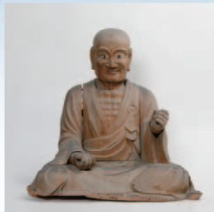
行基菩薩坐像(江戸時代、高天寺橋本院所蔵)