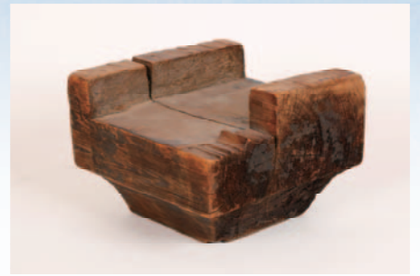
巻斗(飛鳥時代、真言律宗元興寺所蔵)