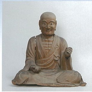
行基菩薩坐像(江戸時代、高天寺橋本院所蔵)