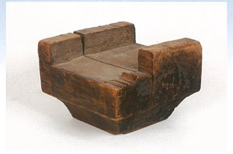
卷斗(飛鳥時代、真言律宗元興寺所蔵)