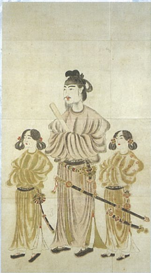
聖徳太子二王子像(江戸時代、法隆寺所蔵)

本展では、元興寺創建の前史として、法興寺の実像に出土遺物などから迫るとともに、関連寺院をはじめ各地に残された法興寺に関わる有形無形の文化遺産を紹介し、元興寺創建への道程を展望します。