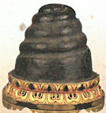
⑪ 大仏螺髻（勧進用） 東大寺蔵 公慶上人が全国を巡って勧進を行った際に宝物を持ち込んだとの記録があり、大仏の大きさを伝えるために用いられたと見られている。