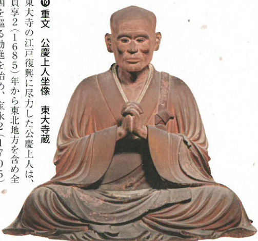
⑨ 重文 公慶上人坐像 東大寺蔵 東大寺の江戸復興に尽力した公慶上人は、貞享2（1685）年から東北地方を含め全国を巡る勧進を始め、宝永2（1705）年に入寂する直前まで活動した。