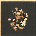
砂金（浦谷町黄金沢採取） 浦谷町教育委員会蔵

現代においても、昭和48年から40年以上にわたり、修二会と呼ばれる除災招福を祈る法会で着用される紙衣に、宮城県の白石和紙が用いられるなど、東大寺と東北には奈良時代から今日に至るまで深いつながりが認められます。本展ではこうした関連資料や宝物も展示します。