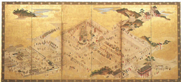
⑫ 大仏開眼供養圖 東大寺蔵 公慶上人によって大仏の修復が成し遂げられ、元禄5（1692）年に行われた大仏開眼供養会の様を描く。