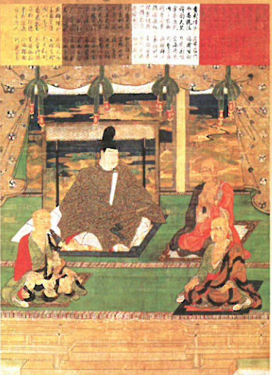
① 重文 四聖御影（永和本） 東大寺蔵 大仏造立を発願した聖武天皇、大仏開眼の導師を務めた菩提樹那、大仏造立の勧進を担った行基菩薩、東大寺初代別当を務めた良弁僧正を描く。