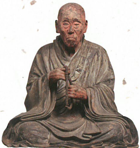
⑦ 国宝 重源上人坐像（5月29日〜6月24日展示） 東大寺蔵 治承4（1180）年の兵火によって、東大寺は大仏と大仏殿をはじめ中心伽藍を焼失。その復興に尽力した、大勧進重源上人の晩年の姿をあらわす。

A special exhibition praying for recovery from the Great East Japan Earthquake