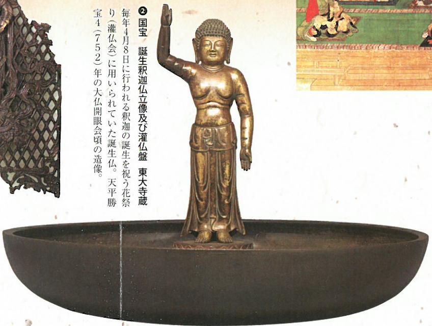
② 国宝 誕生釈迦立像及び灌仏盤 東大寺蔵 毎年4月8日に行われる釈迦の誕生を祝う花祭り（灌仏会）に用いられていた誕生仏。天平勝宝4（752）年の大仏開眼会頃の造像。