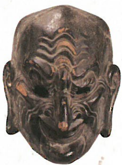
⑤ 重文 伎楽面 醉胡徒（大仏開眼供養会所用） 東大寺蔵 伎楽は仮面をつけて演奏に合わせて演じる無言劇。面裏の墨書により、大仏開眼供養会で上演、使用されたことがわかる。