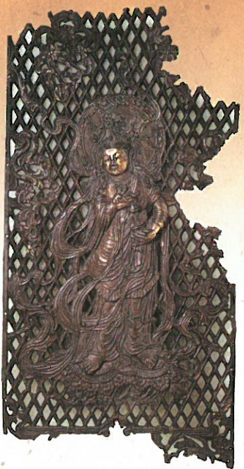
③ 国宝 金銅八角燈籠火袋羽目板 東大寺蔵 大仏殿前庭に安置される、金銅八角燈籠の火袋に嵌められた4枚の羽目板のうちの1枚。奈良時代の東大寺創建当初を伝える作品。