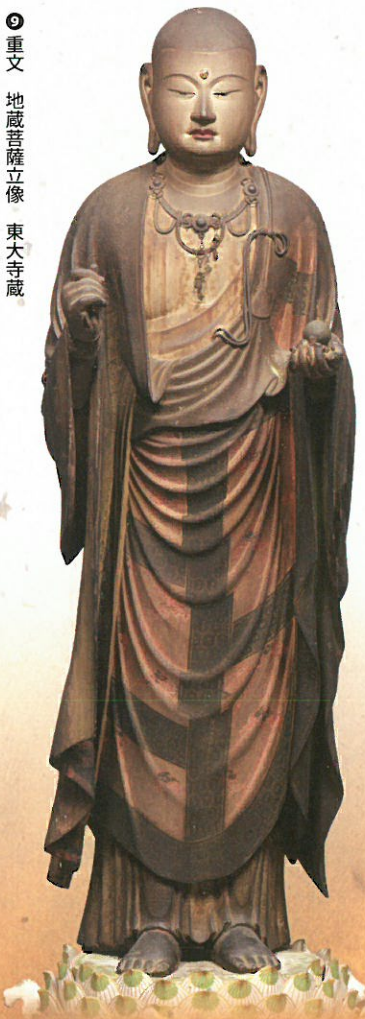
⑧ 重文 地藏菩薩立像 東大寺蔵 重源上人との交流から、鎌倉期の東大寺復興の造仏に活躍した仏師快慶の円熟期の名作。