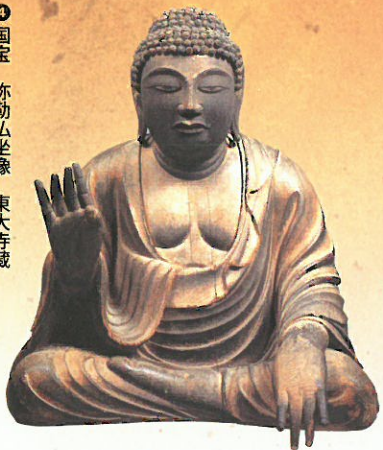
④ 国宝 弥勒仏坐像 東大寺蔵 小像ながら量感に富んだ堂々たる姿を大仏造立の雛形に見立てて「試みの大仏」との通称がある。