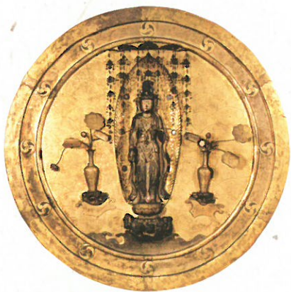
⑩ 二月堂御正躰 東大寺蔵 二月堂の秘仏本尊「十一面観音」のお前立ちとして人々が礼拝する懸仏。公慶上人による大仏殿復興に多大な支援を行った桂昌院（徳川五代將軍綱吉の生母）が奉納。