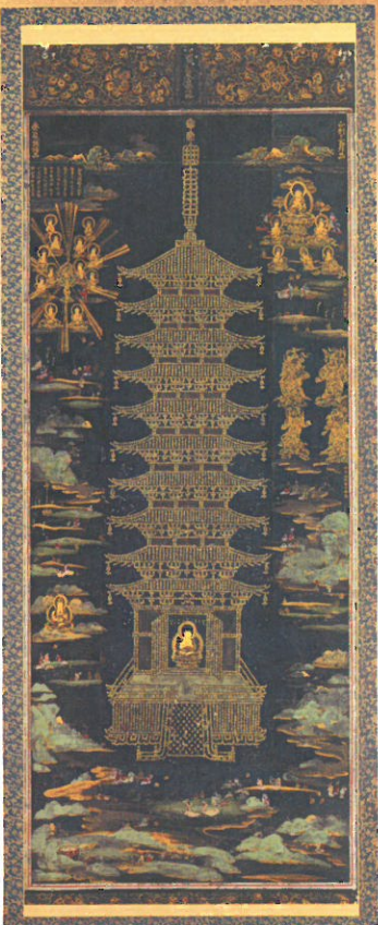
⑥ 国宝 金光明最勝王経金字宝塔曼荼羅圖 中尊寺蔵 紺紙に金泥で「金光明最勝王経」を宝塔の形に書写したもの。平安時代の作で、陸奥国産の金を使用していると思われる。