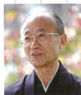
山折 哲雄 宗教学者