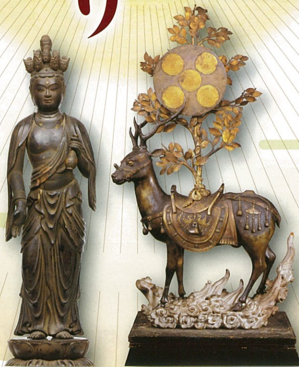
左:十一面観音立像 善田作 鎌倉時代・承久3年(1221) 奈良国立博物館蔵 右:重要文化財 春日神鹿御正体 鎌倉～南北朝時代・14世紀 細見美術館蔵

「藤原氏の氏社・春日大社と氏寺・興福寺を通じて、 神仏習合を読み解き、人々が認めあう未来を探る」