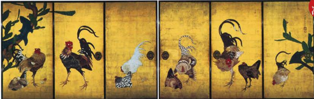
重要文化財 仙人掌鶏図襖 伊藤若冲筆 江戸時代・18世紀 大阪・西福寺蔵