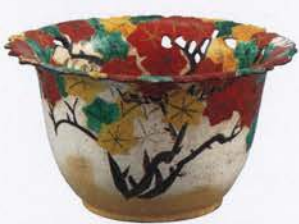
重要文化財 色絵竜田川文透彫反鉢 尾形乾山作 江戸時代・18世紀 神奈川・岡田美術館蔵 [後期展示]