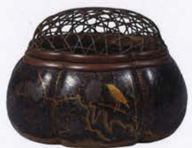
重要文化財 初音菩薩絵火取母 室町時代・15世紀 神奈川・東慶寺蔵