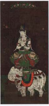
国宝 普賢菩薩像 平安時代・12世紀 東京国立博物館蔵 [前期展示]