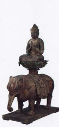
国宝 普賢菩薩騎象像 平安時代・12世紀 東京・大倉集古館蔵