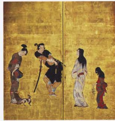
国宝 風俗図屏風(彦根屏風)(部分) 江戸時代・17世紀 滋賀・彦根城博物館蔵 [展示期間=5月15日~5月27日]