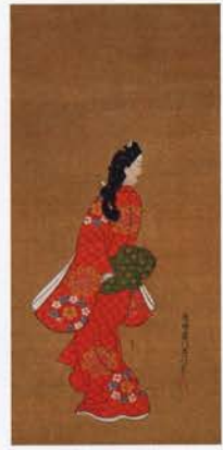
見返り美人図 菱川師宣筆 江戸時代・17世紀 東京国立博物館蔵