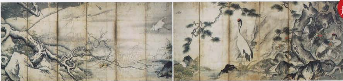
重要文化財 四季花鳥図屏風 雪舟等揚筆 室町時代・15世紀 京都国立博物館蔵 [前期展示]