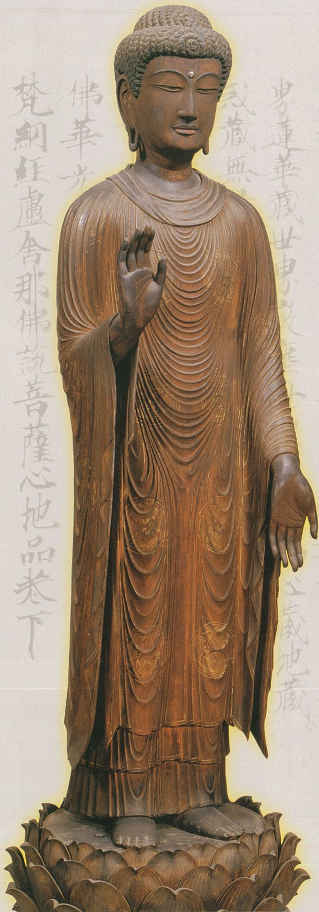
重要文化財 釈迦如来立像(礼堂所在) 唐招提寺