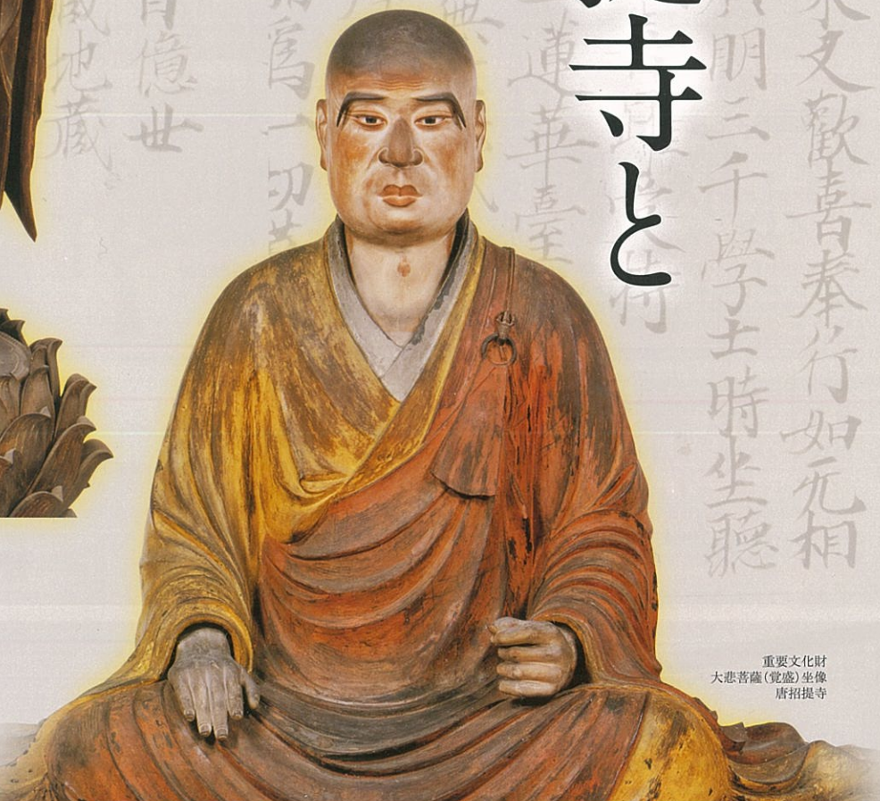
重要文化財 大悲菩薩(覺盛)坐像 唐招提寺