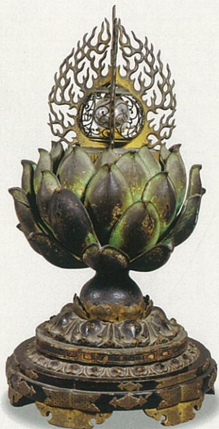
重要文化財 火焰宝珠形舍利容器(日供舍利塔) 唐招提寺

本展は、今年(二〇一九年)で覚盛上人の入滅から七百七十年となるのを機に、上人の事績を顕彰するとともに、その前後に活躍した貞慶、證玄といった高僧にも触れ、鎌倉時代の唐招提寺と戒律復興について紹介するものです。初出陳となる證玄骨蔵器をはじめ、貴重な品々をこの機会にぜひとも鑑賞ください。