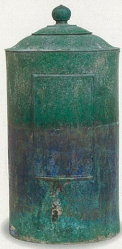
證玄骨蔵器 西方院