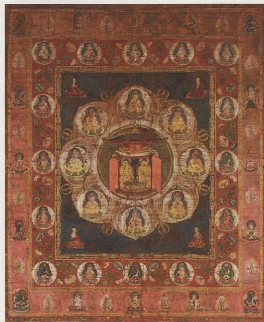
重要文化財 法華曼荼羅 唐招提寺