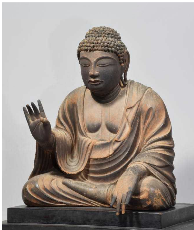
もくぞうみろくぶつざぞう 木造弥勒仏坐像 宗教法人東大寺