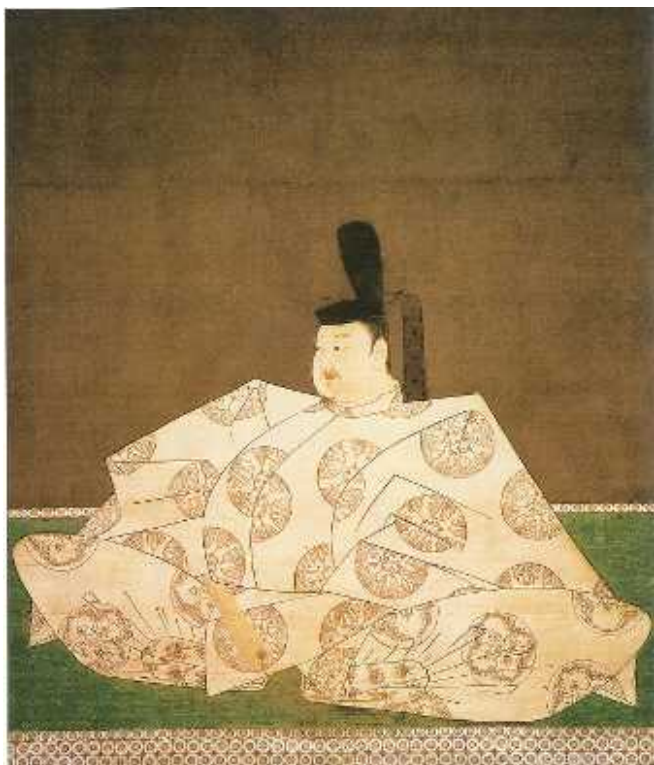
けんぼんちやくしよくと ぼてんのうぞう 絹本 著色鳥羽天皇像 しんぎしんごんしゅうそうほんざんねごろじ 宗教法人新義真言宗総本山根来寺