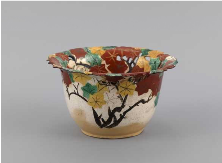
おがたけんざん 尾形乾山作 いろ え たつ た がわもんすかしぼりそりばち 色絵竜田川文透彫反鉢 岡田美術館