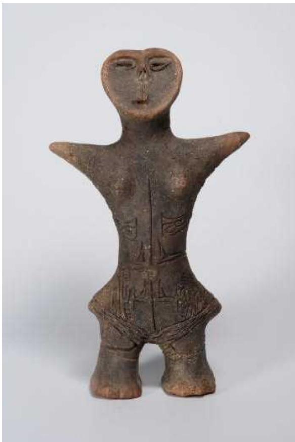
どぐう 土偶 富士見町