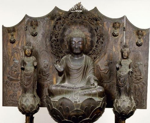
国宝 阿弥陀三尊像(伝橋夫人念持仏)(奈良・法隆寺) 〈白鳳展出陳作品〉

七世紀半ばから七一〇年の平城京遷都までの白鳳時代には、若々しく明るいきれな空気に満ちた仏教文化が開花しました。このフォーラムでは白鳳文化誕生の時代背景や万葉集にも触れながら、白鳳美術の魅力が多角的に紹介します。