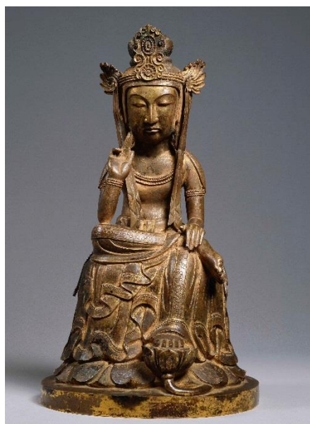
重要文化財 弥勒菩薩半跏像(大阪・野中寺) 〈白鳳展出陳作品: 展示期間7/19~9/16〉