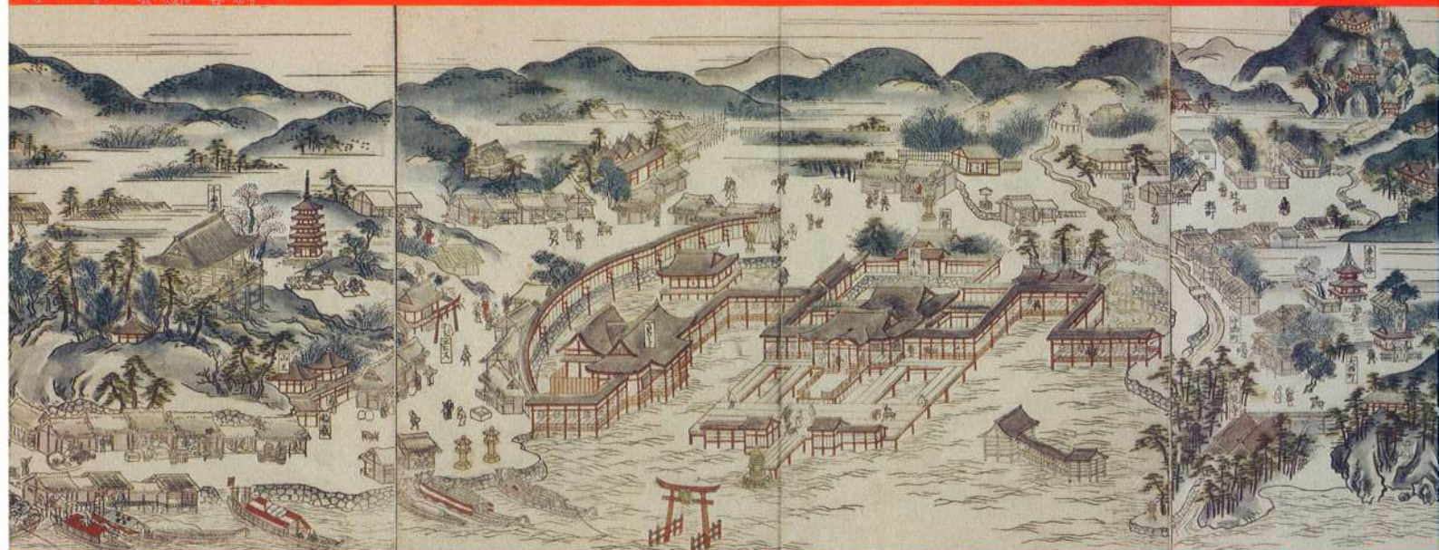
安芸国厳島勝景図并記事 宮島歴史民俗資料館 蔵