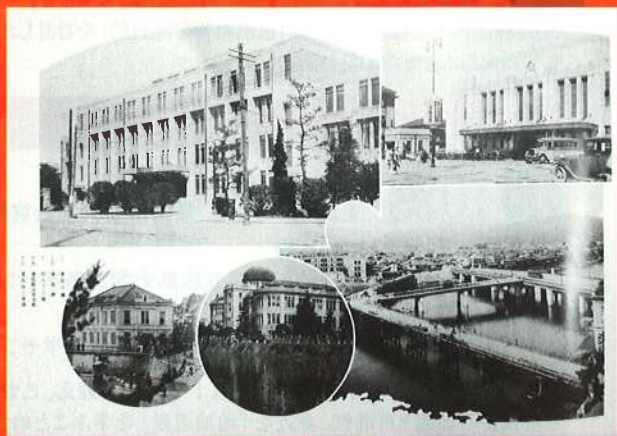
広島県史蹟名勝写真真帖