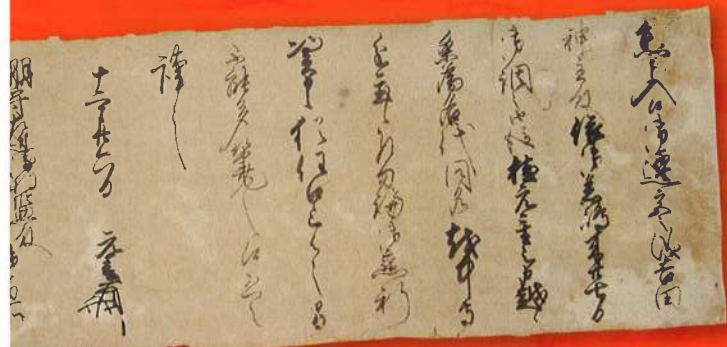
吉川元春書状 宮島学センター 蔵