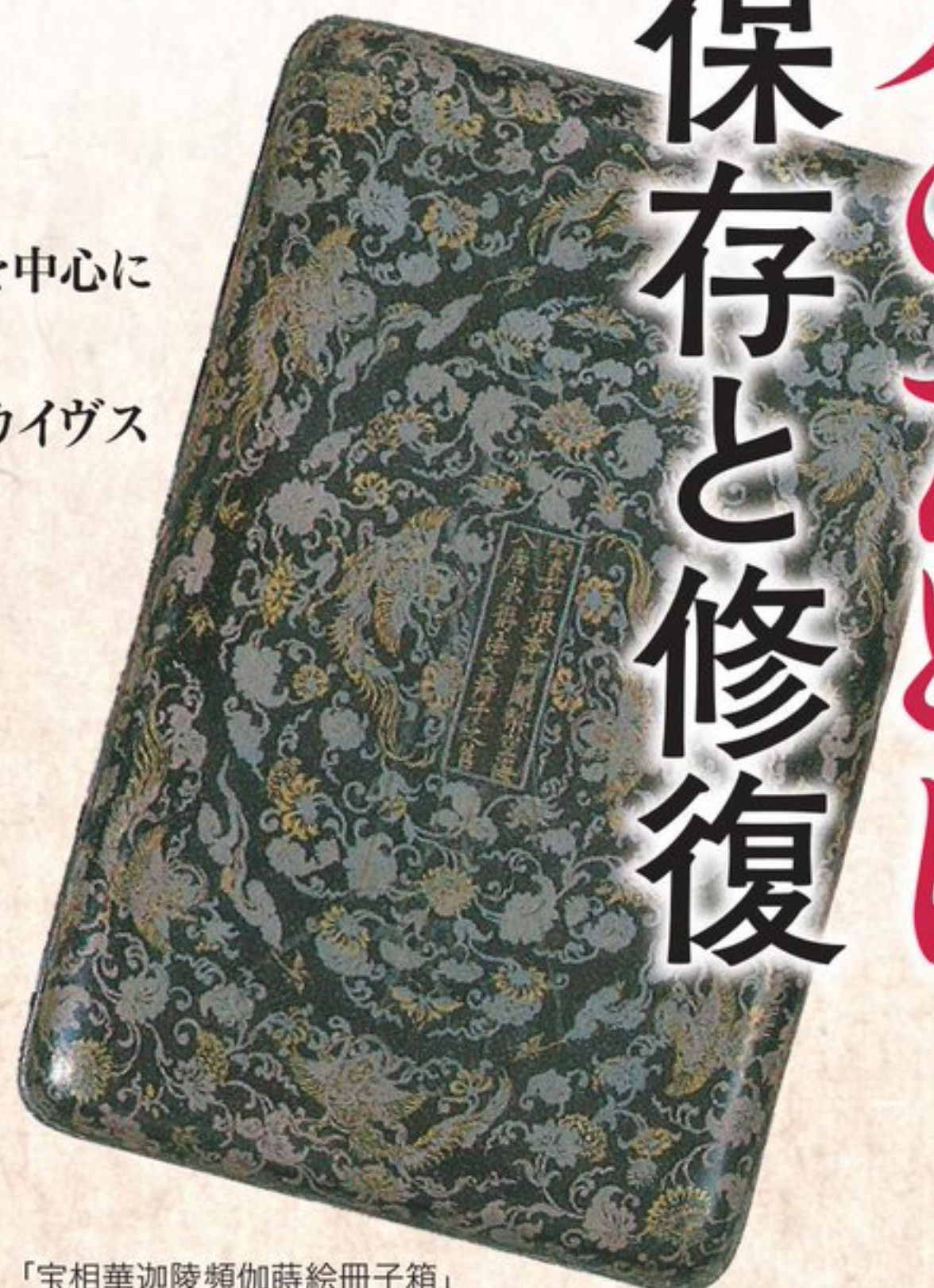
「宝相華迦陵頻伽詩繪冊子箱」 【仁和寺蔵】