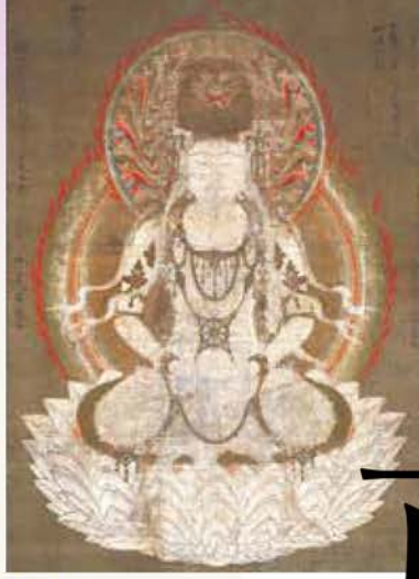
後期 国宝 仏眼仏母像 平安～鎌倉時代 京都・高山寺蔵