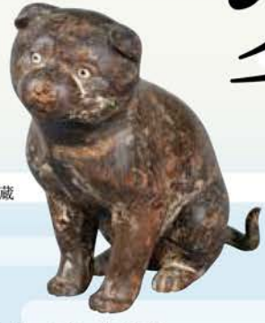
重要文化財 子犬 鎌倉時代 京都・高山寺蔵