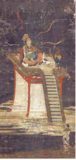
前期 春和夜神像 鎌倉時代 京都・高山寺蔵