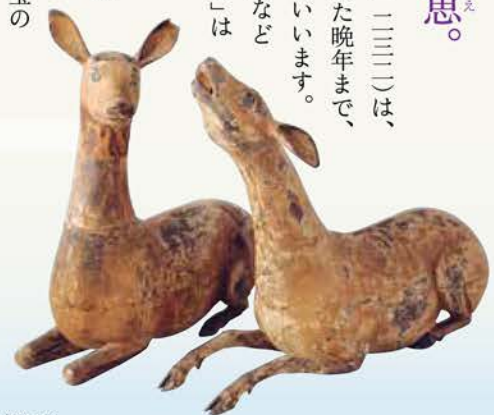
重要文化財 神鹿 鎌倉時代 京都・高山寺蔵