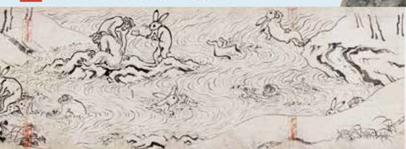
前期 国宝 鳥獣戯画甲巻 平安時代 京都・高山寺蔵

ウサギや蛙、幻想的な聖獣が躍動する甲巻・乙巻は前期に、動物とともに滑稽味あふれる人の世界を描き出した丙巻・丁巻は後期に展示します。明恵の夢の世界と一脈通ずる鳥獣戯画の世界をご堪能ください。