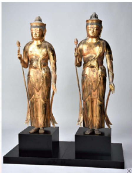
①十一面観音立像(重要文化財・奈良時代・円満寺蔵)、②十一面観音立像(和歌山県指定文化財・平安時代・名杭観音講蔵)、③高野明神立像(平安時代・横尾山明神社蔵)、④観音菩薩立像(鎌倉時代・霊現寺蔵)、⑤不動明王立像(弘安4年(1281)・大泰寺蔵)、⑥阿弥陀三尊像(延元元年(1336)・建武4年(1337)・持宝寺蔵)、⑦熊野速玉大神坐像(国宝・平安時代・熊野速玉大社蔵)、⑧大日如来坐像(重要文化財・康平5年(1062)・有田市蔵)、⑨丹生明神坐像(和歌山県指定文化財・鎌倉時代・三谷薬師堂蔵)、⑩伝大日如来坐像(鎌倉時代・深専寺蔵)、⑪観音菩薩立像(平安時代・観音寺蔵・右側は3Dプリンター製のお身代わり仏像)