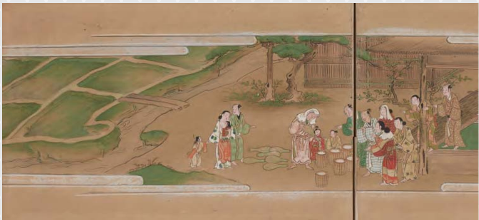
『雀の夕顔絵巻貼付屏風』