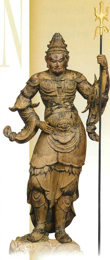
毘沙門天立像 平安時代 滋賀・高尾地蔵堂

本展には、このような多彩な展開を遂げた日本の毘沙門天像のなかから、選りすぐりの優品の出陳ができませんでした。これにくわえ、近年新発見された作品やそれらに関する新たな知見をまじえつつ、魅力にあふれた毘沙門天像の世界に皆さまを誘いたいと思います。