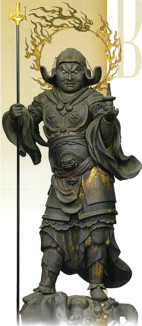
毘沙門天立像 鎌倉時代 奈良国立博物館

してんのう じこくてん・ぞうちやうてん こうもくてん たもんでん しゆみせん 四天王(持国天・增長天・広目天・多聞天)は、須弥山世界の四方にいて、仏教世界や仏法を守るカミです。このうち北方を守護する多聞天は、 びしゃもんてん 「毘沙門天」の名で単独の像としても造像、信仰され、四天王のなかでも特別の存在でした。ただし日本においては、たんなる仏教世界の守護神であるにとどまらず、仏教修行者を守り、これに福を与えたり、念仏の信者を保護したりする存在であるとも信じられました。このような福德神的な性格は、後に七福神のなかの一尊である毘沙門天のイメージにつながってゆくものと思われます。