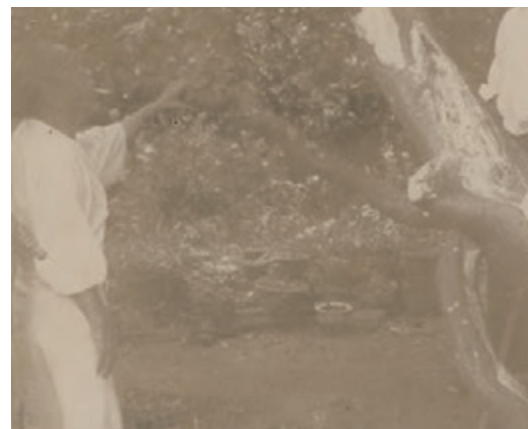
安藤蜜柑の手入れを見守る熊楠 [関連 0440]