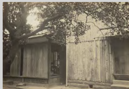
南方熊楠邸書斎と書庫 [関連 0425]