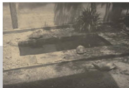
南方熊楠邸北面の亀池 [関連 0778]