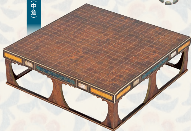
桑木木画碁局（中倉）