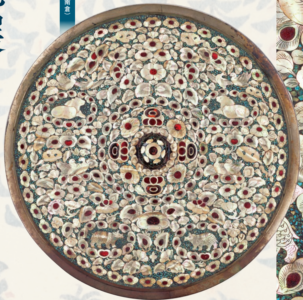
平螺鈿背円鏡（南倉）