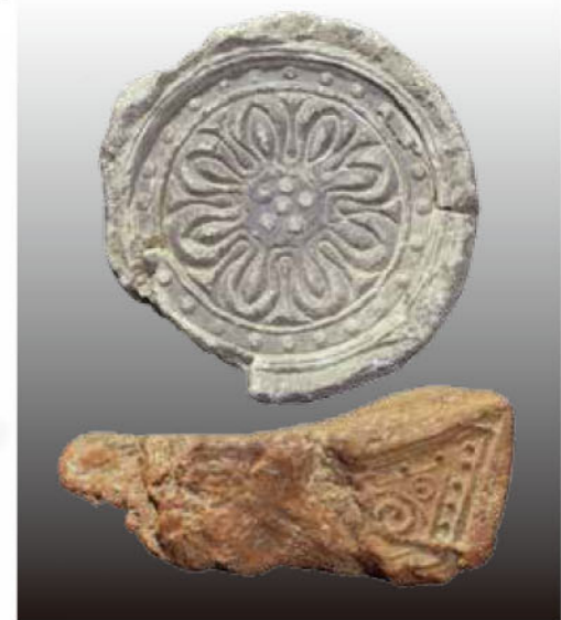
丹後国分寺跡出土瓦(国分寺蔵)