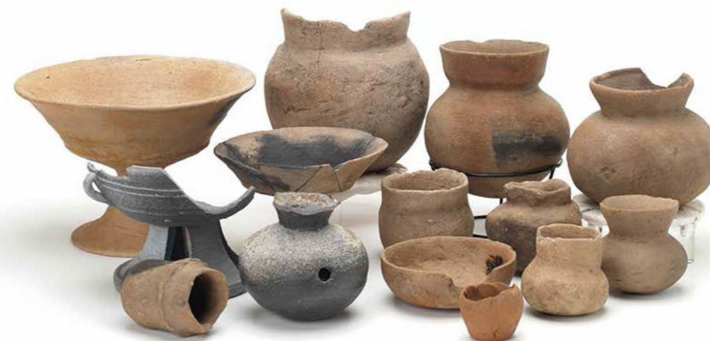
難波野遺跡出土祭祀土器(公益財団法人京都府埋蔵文化財調査研究センター蔵)

本展では、天橋立を中心とした地域の地理的・歴史的環境の中で丹後国分寺について考えます。