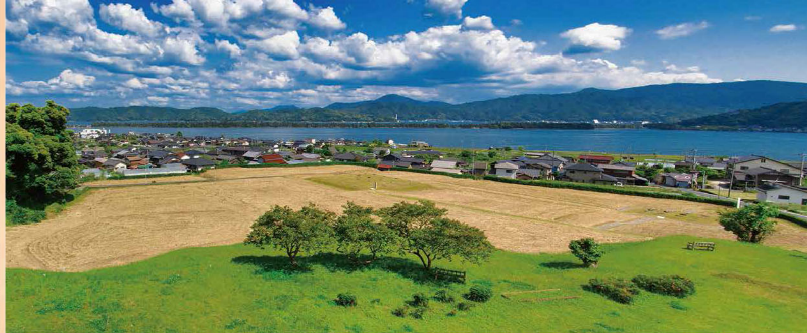
当館から見た天橋立と丹後国分寺跡

本年、当館は、昭和45(1970)年11月7日の開館から50周年を迎えます。当館の建設に先立って、国史跡・丹後国分寺跡を含めて用地が購入され、史跡の環境整備と資料館の建設工事が相次いで行われたことからわかるように、当館は、丹後国分寺跡に隣接する史跡博物館としての性格を持っています。