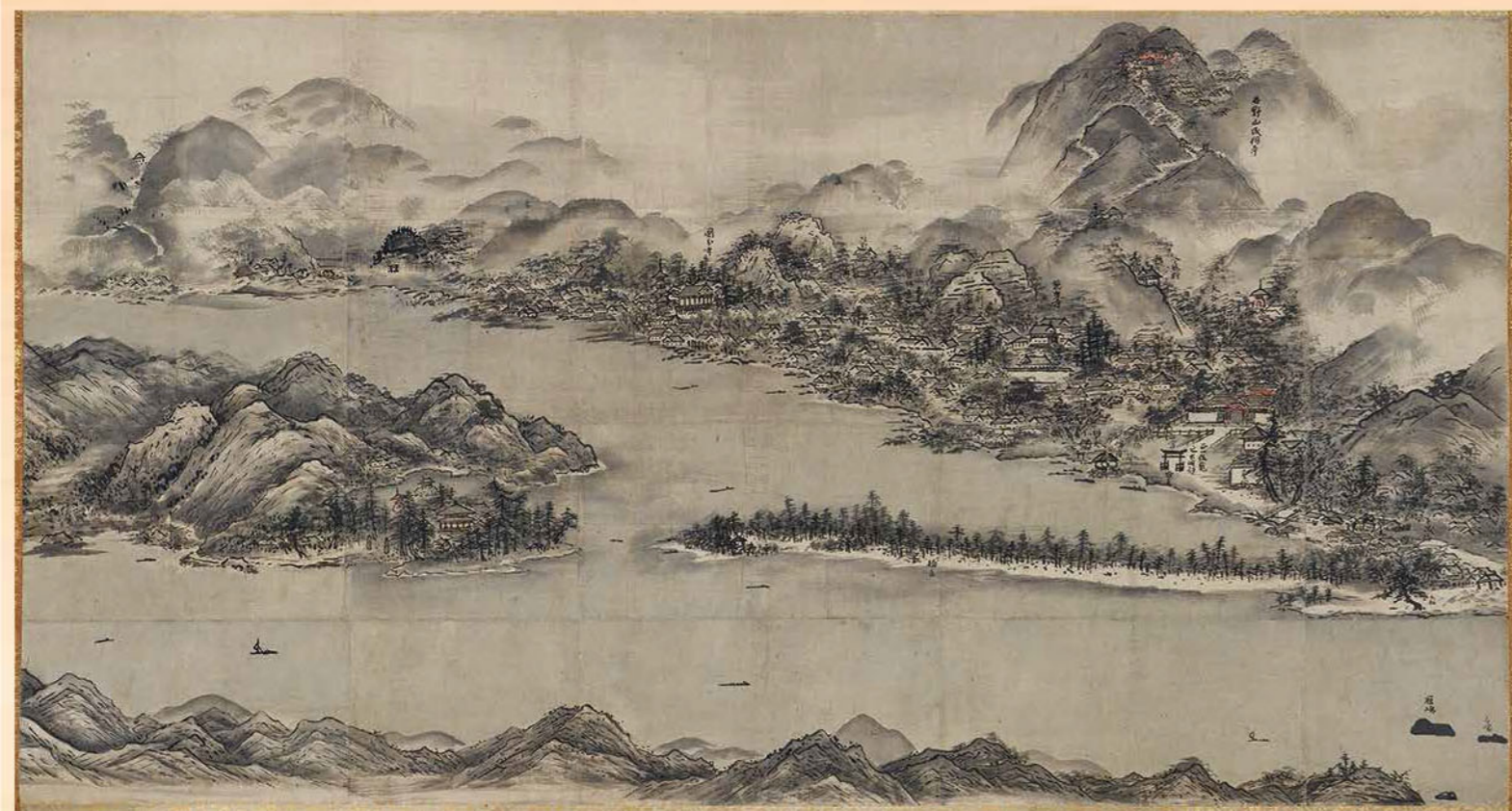
雪舟筆「天橋立図」(国宝・京都国立博物館蔵 10/31～11/23 期間限定展示)