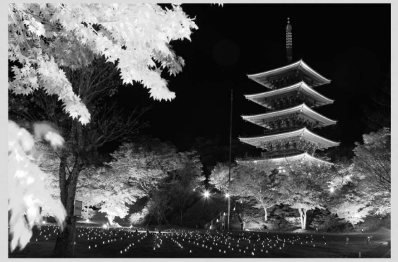
成相寺のライトアップ