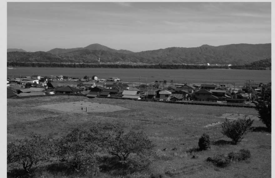
国史跡 丹後国分寺跡