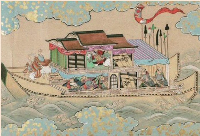
重要文化財 石清水八幡宮御縁起絵巻