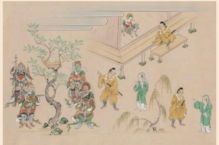
木津川市指定文化財 橋柱寺縁起絵巻