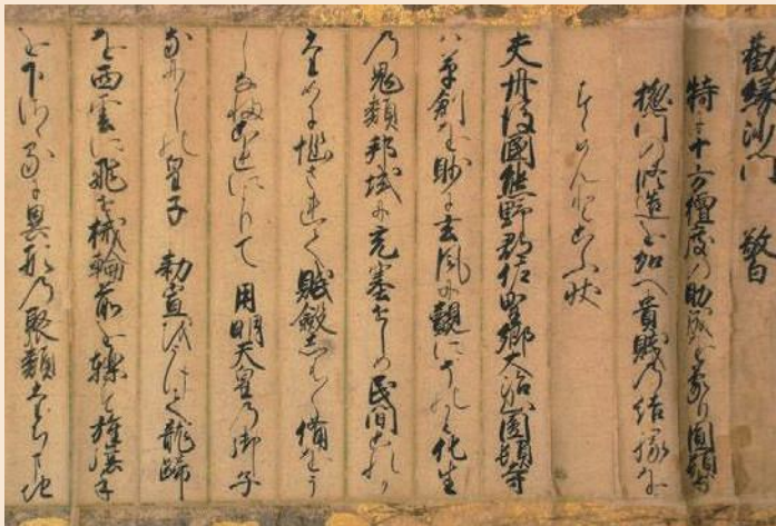
京都府指定文化財 円頓寺惣門再興勸進状 三条西実隆筆 円頓寺蔵

現在のアニメーションのルーツとも言われる絵巻物は、巻物を開きながら読み進めることによって描かれた場面の時間が経過する、物語や由緒を伝えるのに適した絵画形式のひとつです。中世から近世にかけて、寺社の造営や再興のための寄附を集める「勸進」を目的として、寺社縁起を描いた絵巻が数多く作られました。今回の展示では、京都府内に残された絵巻と勸進状を集め、寺社縁起と勸進のあり方を探ります。