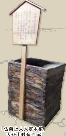
「仏海上人入定木箱」 大悲山観音寺蔵