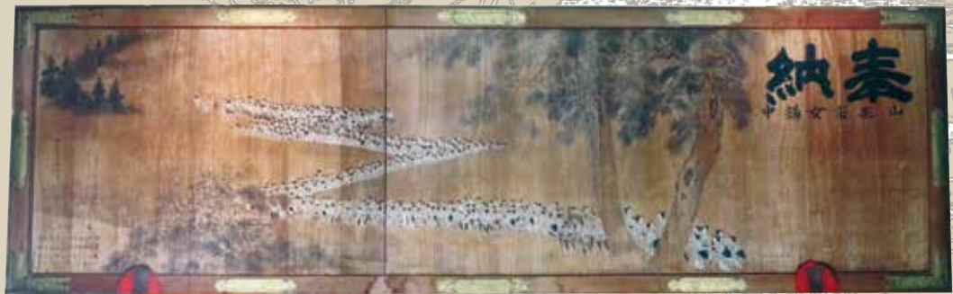
「板絵 出羽三山女講中参詣図(複製)」西川町歴史文化資料館蔵