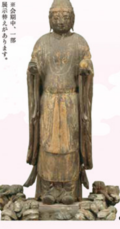
※会期中、一部展示替えがあります。