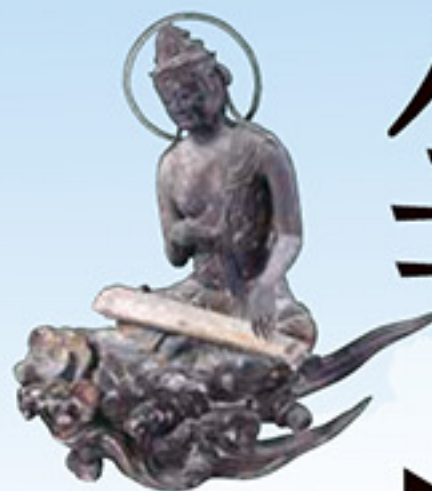
国宝 《雲中供養菩薩像 北1号》 (前期展示)