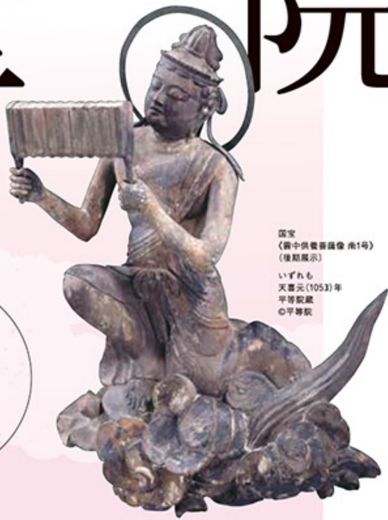
国宝 《雲中供養菩薩像 南1号》 (後期展示) いづれも 天壽元(1053)年 平等院蔵 ○平等院