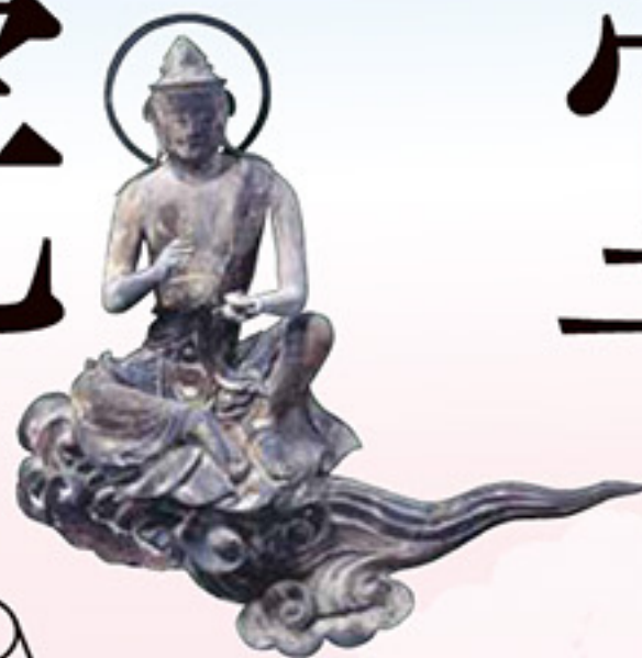
国宝 《雲中供養菩薩像 北13号》 (後期展示)