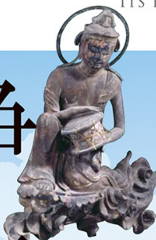
国宝 《雲中供養菩薩像 南14号》 (前期展示)