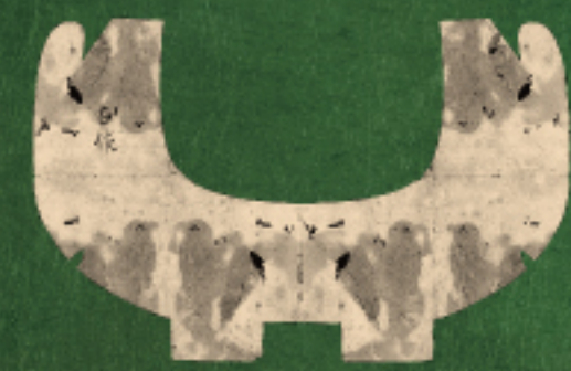
古田左介(織部) 前欠風炉切形