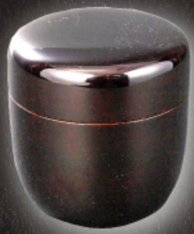
利休形 黒大棗 文叔宗守在判 静々斎宗守 箱書付