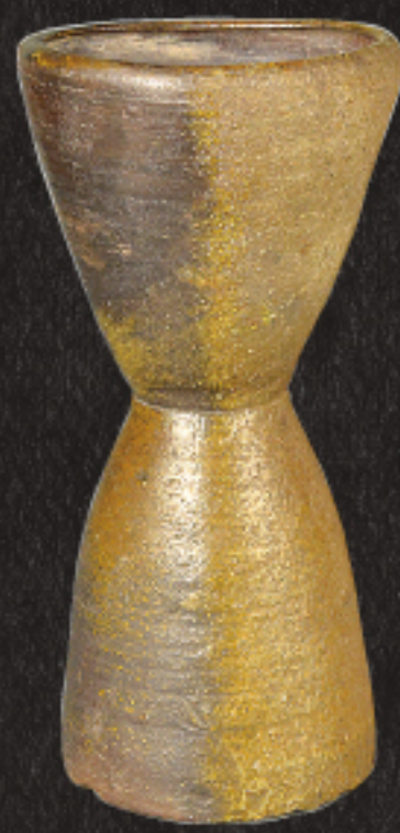
利休切形 備前立鼓花入