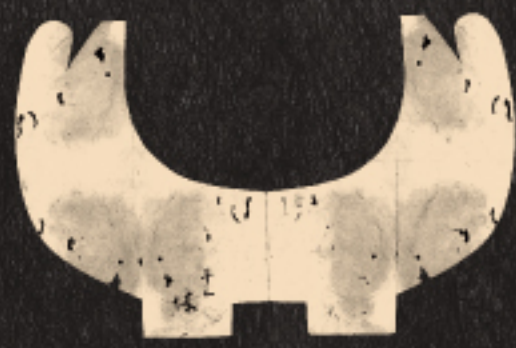
千利休(平三へ贈) 前欠風炉切形