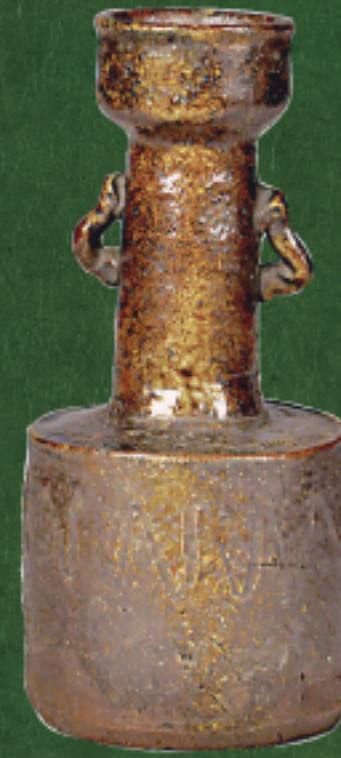
古丹波 耳付 砧形花入