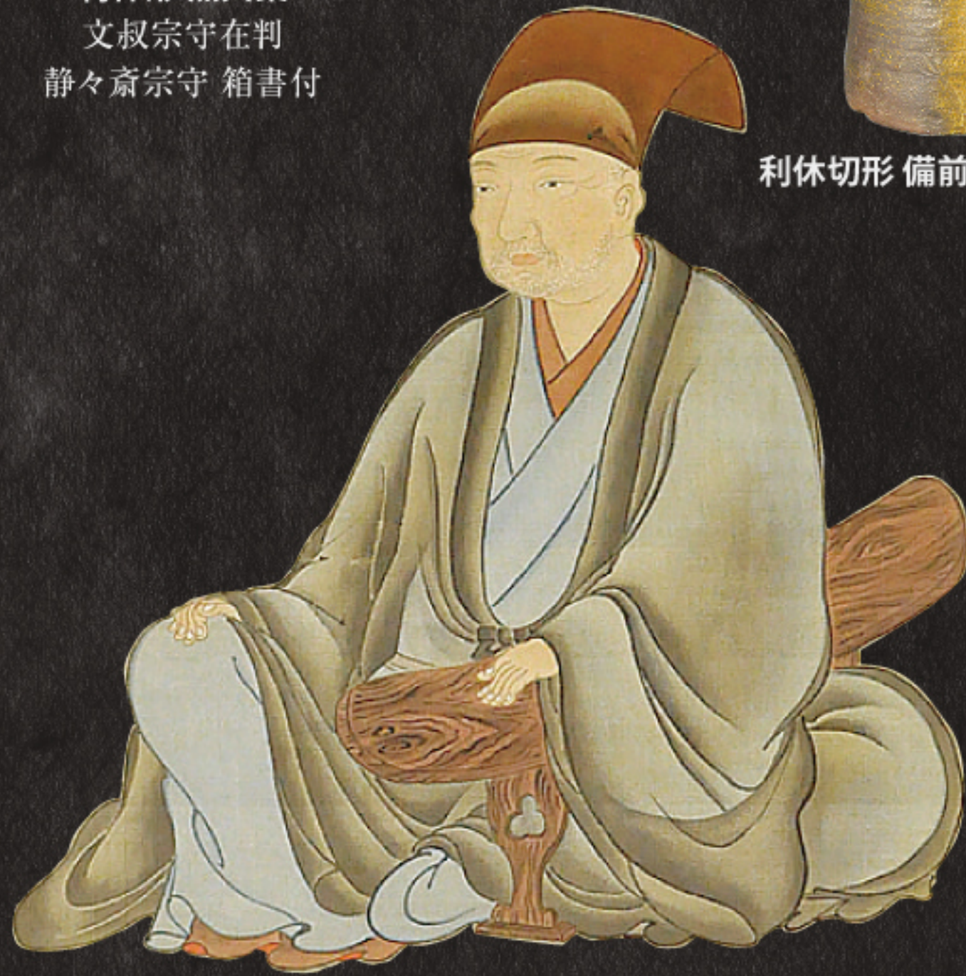
千利休像 鶴沢探鯨画 竺嶺宗伍(大徳寺314世)賛 土田友湖家伝来