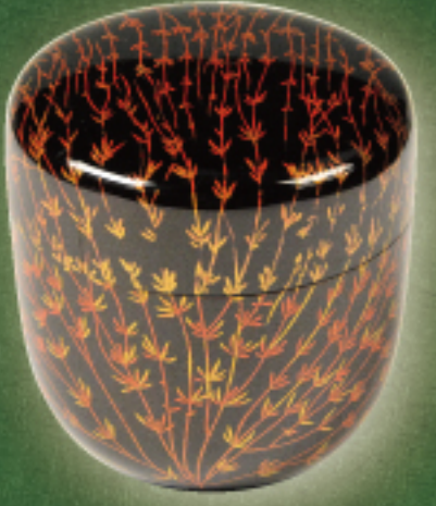
織部好 芽張柳蒔絵 黒大棗 啐啄斎 箱書付